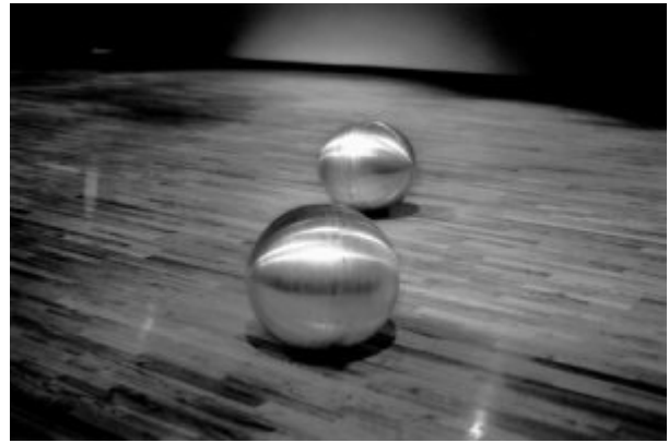
Silverfish Stream - © Constanza Silva, 2005

Silverfish Stream , l'œuvre de Constanza Silva , reflète également la fusion inhérente d'art, de science et de technologie grâce à l'intégration de sphères sensorielles en aluminium. Ses sphères produisent des mouvements à partir de « mécanismes intérieurs déclenchés par capteurs » en réagissant aux observateurs en mouvement autour d'elles. Elles se comportent comme des êtres humains et mettent en doute la perception qu'elles ne sont que des robots.