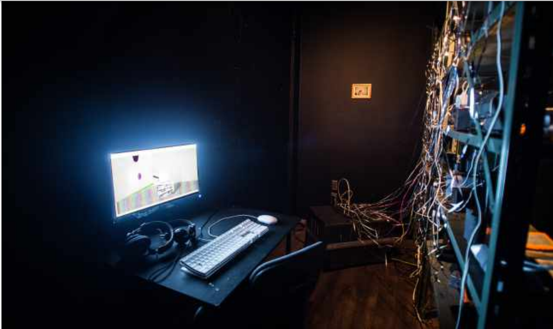
Frédérique Laliberté, Infiniteme.com Forever A Prototype (2015-).